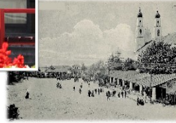
Органам ЗАГС 105 лет.

История отдела ЗАГС Днепропетровского района ведёт свое начало с 1940 г.